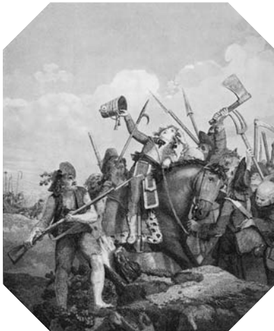
Mort héroïque du jeune Barra, dédiée aux jeunes Français. Eau-forte et aquatinte. BNF, Estampes et photographie, Rés. Qb-201 (133)-Fol.

Les révolutionnaires de 1789, héritiers des Lumières, ont beau valoriser les mérites des grands hommes et honorer leur mémoire au Panthéon, temple laïc qui leur est consacré à partir de 1791, les urgences et les bouleversements politiques les contraignent à réhabiliter les personnages héroïques. L'historienne Mona Ozouf a clairement établi la distinction entre ces deux figures de l'excellence : « Le grand homme ne doit rien au surnaturel alors que le héros réussit une action qui tient du miracle. Le héros est l'homme de l'instant